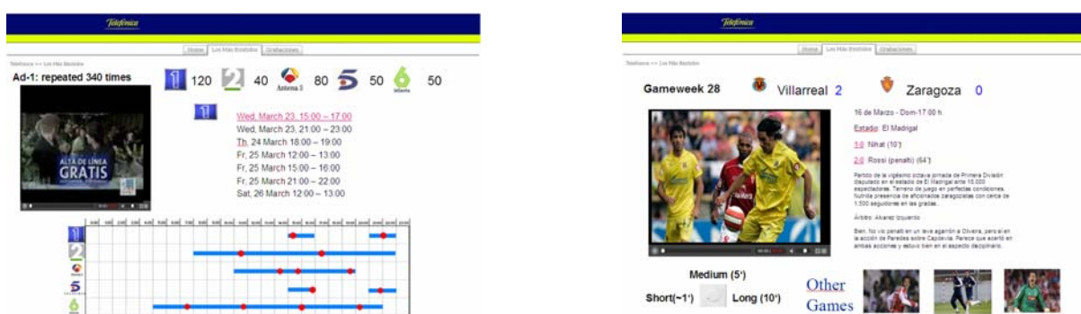
Fig. 3. Vistas detalladas de las apariciones de un anuncio y del resumen de un partido de fútbol.

En el caso de la sección de detección de los momentos importantes en los partidos de fútbol, existen dos vistas. En la primera de ellas se muestra la lista de partidos de la jornada que el usuario escoja. El usuario puede elegir un partido de la lista, y de este modo accederá a la segunda vista. Esta segunda vista permite generar automáticamente un resumen del partido escogido, con sus momentos más importantes. El usuario puede elegir la duración del resumen, lo que permite ajustar el umbral que clasifica un momento del partido como importante o no.